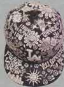
ニューエラのキャップ ツバの裏にもしっかりとペインティングを施した。当然ハンドペイントなので1点もの。その他自転車のフレームなどにも施している