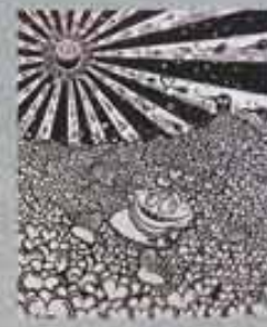
アートワーク 今年に入って初めて描いたという最新作。オリジナルキャラクターであるタカラトレジャーがハートに埋められている。3日で完成