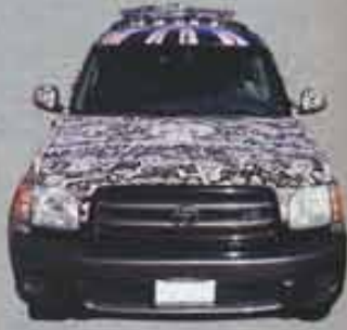
トヨタのセコイア アメリカの移動手段として使っているのが、トヨタのセコイア。このクルマで全米中を旅することで、次の作品への意欲を高めるそう