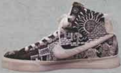
ナイキのプレイザー ナイキのプレイザーに、ハンドペイントしたアートワーク。スニーカーのデザインと輪の横図のバランスが素晴らしい仕上がり